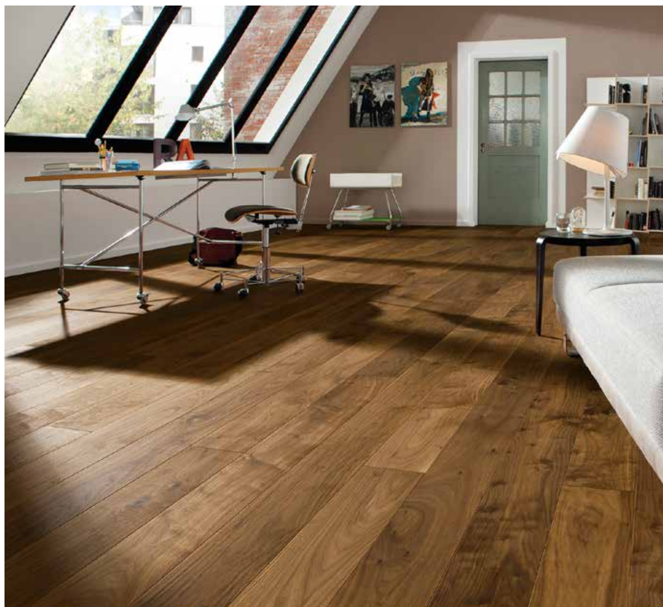
Plancia 1-strip Noce americano spazzolato 4B

Tutte le superfici in vero legno MULTIVO hanno una cosa in comune: una bellezza naturale per casa vostra.