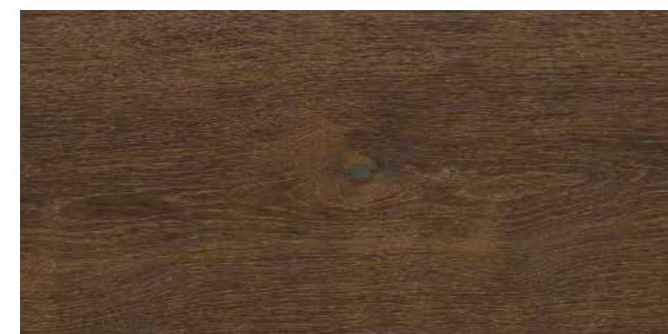
Plancia 2-strip Rovere anticato spazzolato 4B N. art. 544598