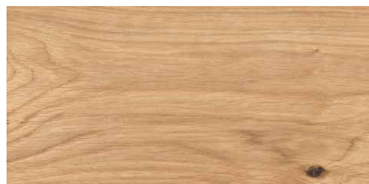
Plancia 1-strip Rovere Elegant spazzolato 4B N. art. 544592