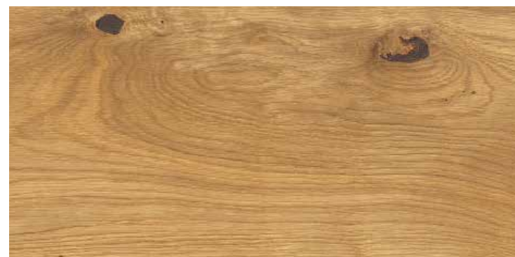
Plancia 1-strip Rovere Naturale spazzolato 4B N. art. 544594