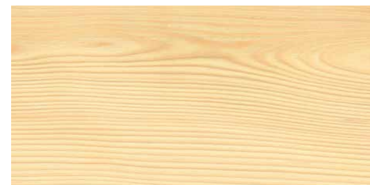
Plancia 2-strip Abete spazzolato 4B N. art. 544596