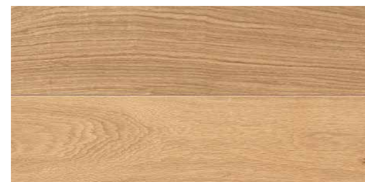
Plancia 2-strip Rovere Elegant spazzolato 4B N. art. 544593