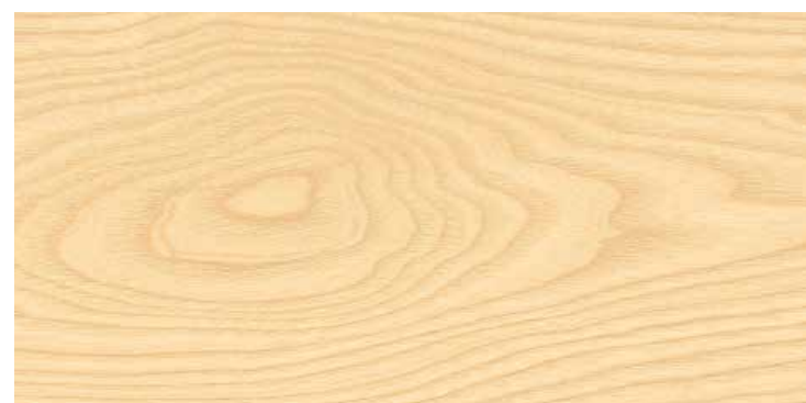
Plancia 1-strip Frassino spazzolato 4B N. art. 544597